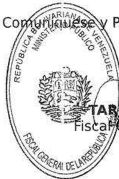
TAREK WILLIAMS SAAB Fiscal General de la República