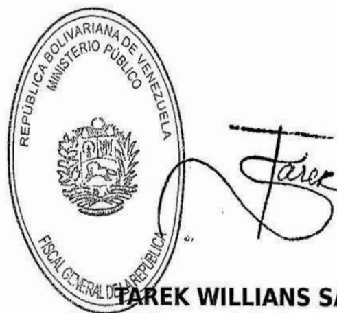
TAREK WILLIANS SAAB Fiscal General de la República