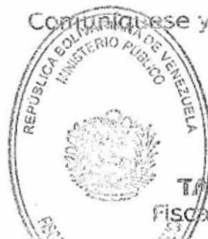
TAREK WILLIAMS SAAB Fiscal General de la República