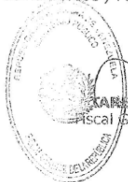
TAREK WILLIAMS SAAB Fiscal General de la República