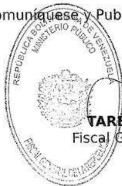
TAREK WILLIANS SAAB Fiscal General de la República