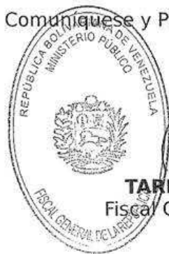
TAREK WILLIANS SAAB Fiscal General de la República