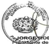
JORGE RODRÍGUEZ GÓMEZ Presidente de la Asamblea Nacional

Dado, firmado y sellado en el Palacio Federal Legislativo, sede de la Asamblea Nacional, en Caracas, a los veintidós días del mes de agosto de dos mil veinticuatro. Años 214° de la Independencia, 165° de la Federación y 25° de la Revolución Bolivariana.