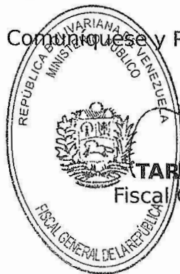
TAREK WILLIANS SAAB Fiscal General de la República