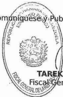
TAREK WILLIAMS SAAB Fiscal General de la República